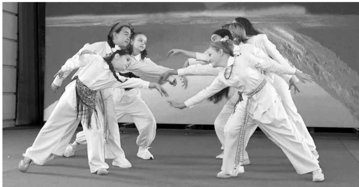
Концерт в честь Дня защиты детей в амфитеатре парка «Зеленый остров» в Черкесске

По данным Корпорации МСП, сегодня в стране почти 90 тысяч малых и средних предприятий работают в сфере образования и развития детей. За последний год их число выросло на 10 %, а за три года — более чем на 40 %. В КЧР за три года количество предпринимателей, оказывающих услуги для детей, увеличилось на 107 %, что стало одним из лучших показателей в стране. Большинство таких организаций работают в сфере дообразования: это центры развития интеллекта, языковые и художественные школы, танцевальные студии, спортивные секции и т. д.