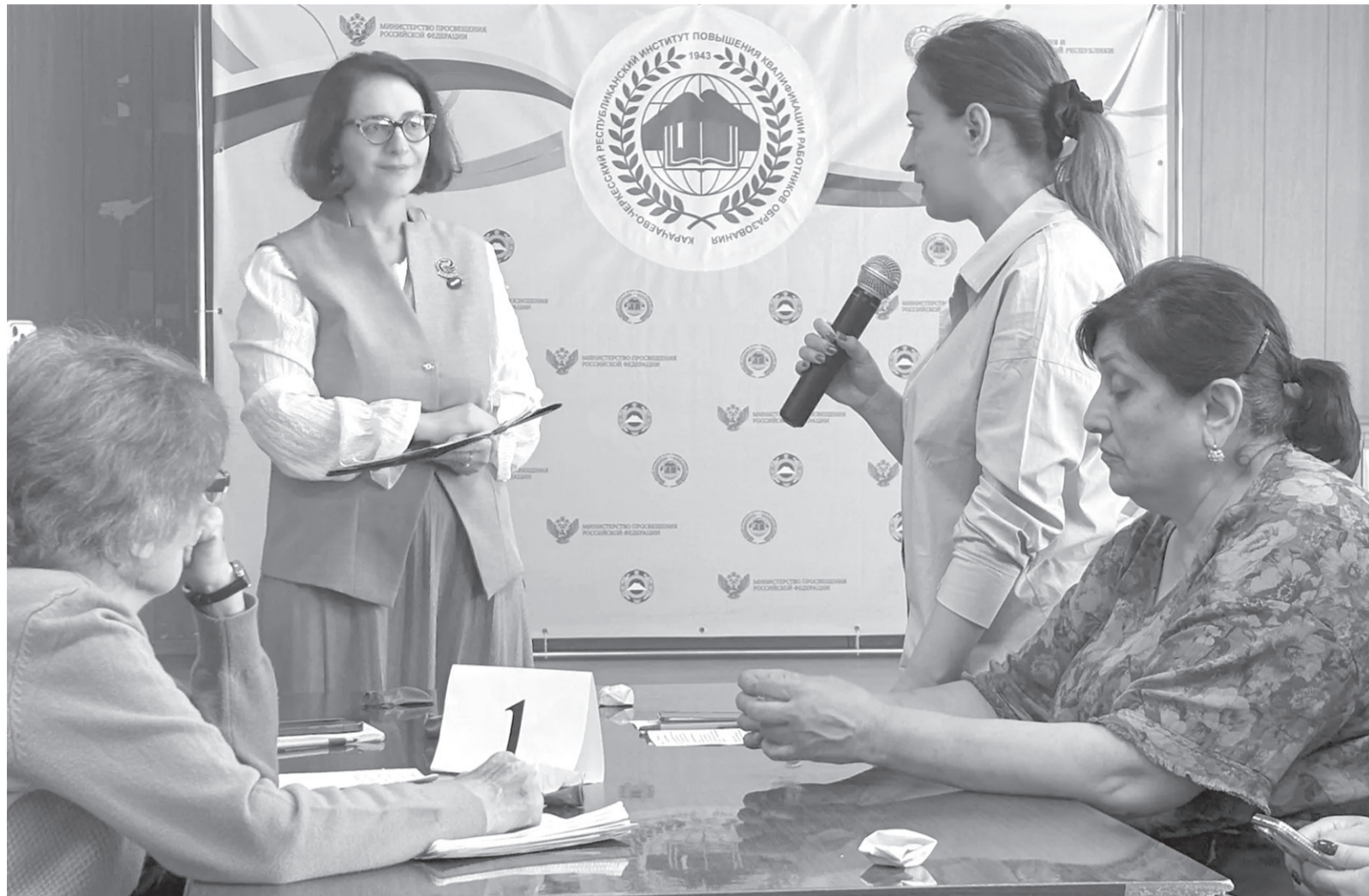
Форум классных руководителей стал отличной площадкой для профессионального общения

Прошел первый в КЧР Форум классных руководителей