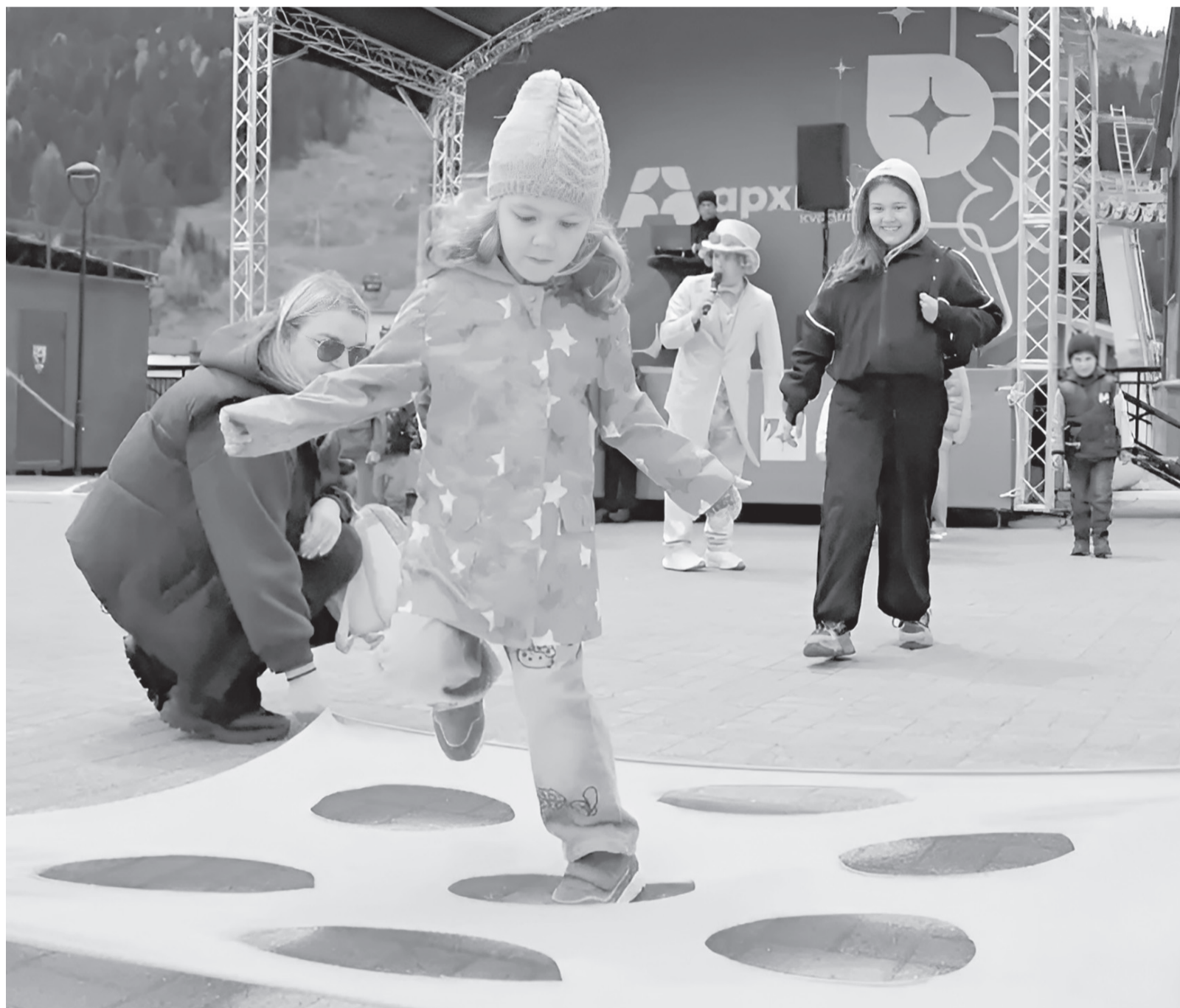
В Архызе забав для детей было множество

Республика отметила Международный день защиты детей